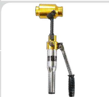
پانچ هیدرولیک دستی مدل: KHP22-60 قیمت: 9/850/000