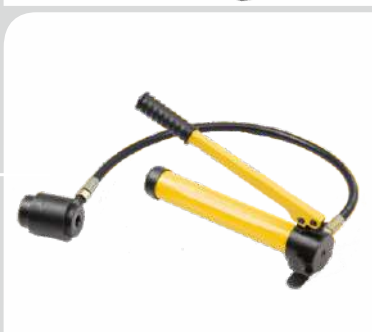
پانچ هیدرولیک دستی شیلنگ دار مدل: RHP-8 قیمت: 18/800/000