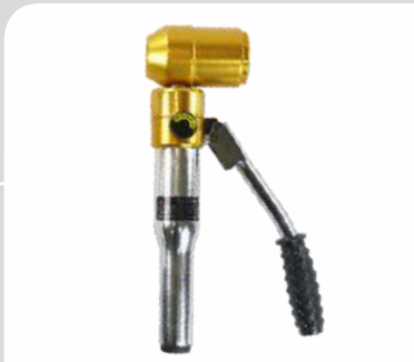
پانچ هیدرولیک دستی مدل: KHB22-60 قیمت: 7/850/000