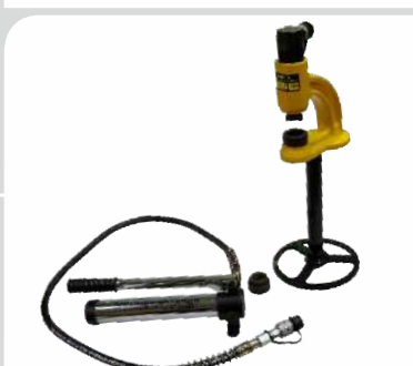
پانچ هیدرولیک رومیزی فک دار مدل: RHP80 قیمت: 14/600/000