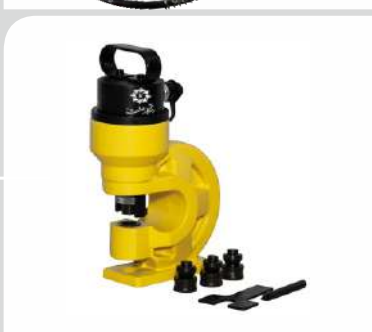
پانچ هیدرولیک ایستاده مدل: RHS-60 قیمت: 16/800/000